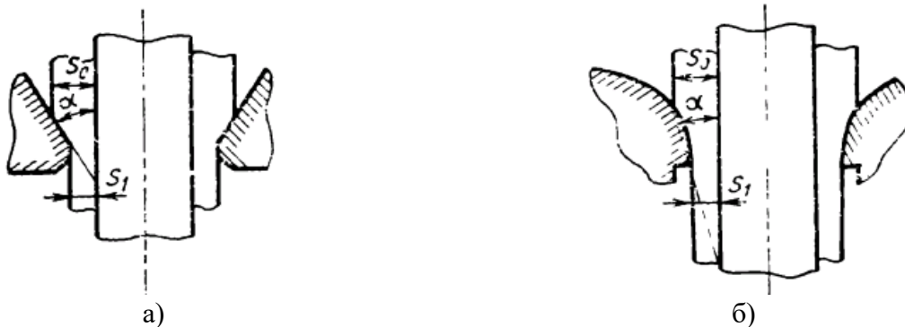
Рис. 1. Схема вытяжки с утонением стенки:

а) через конусную матрицу, б) через радиальную матрицу